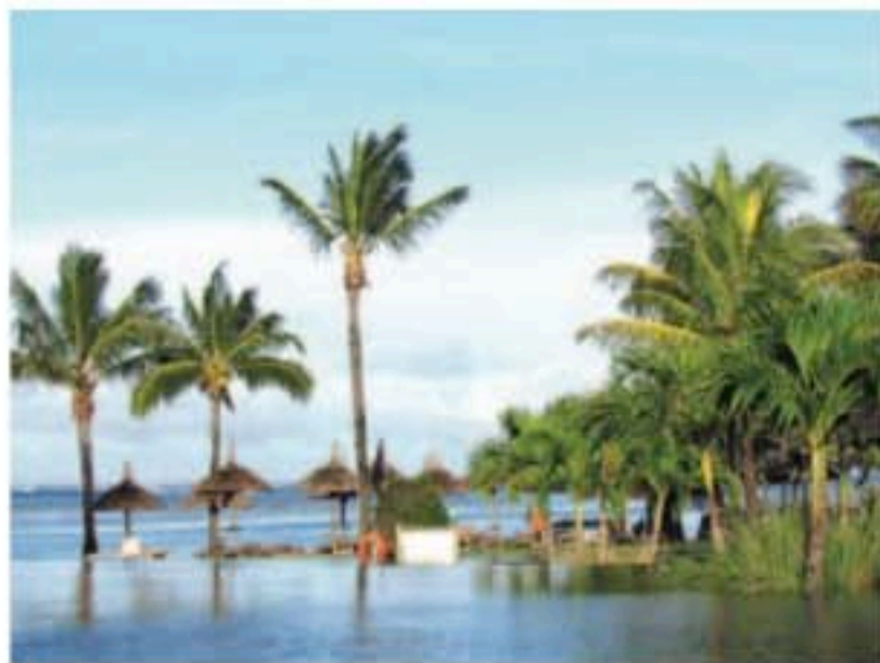
■ L'Awali Resort : un style africain