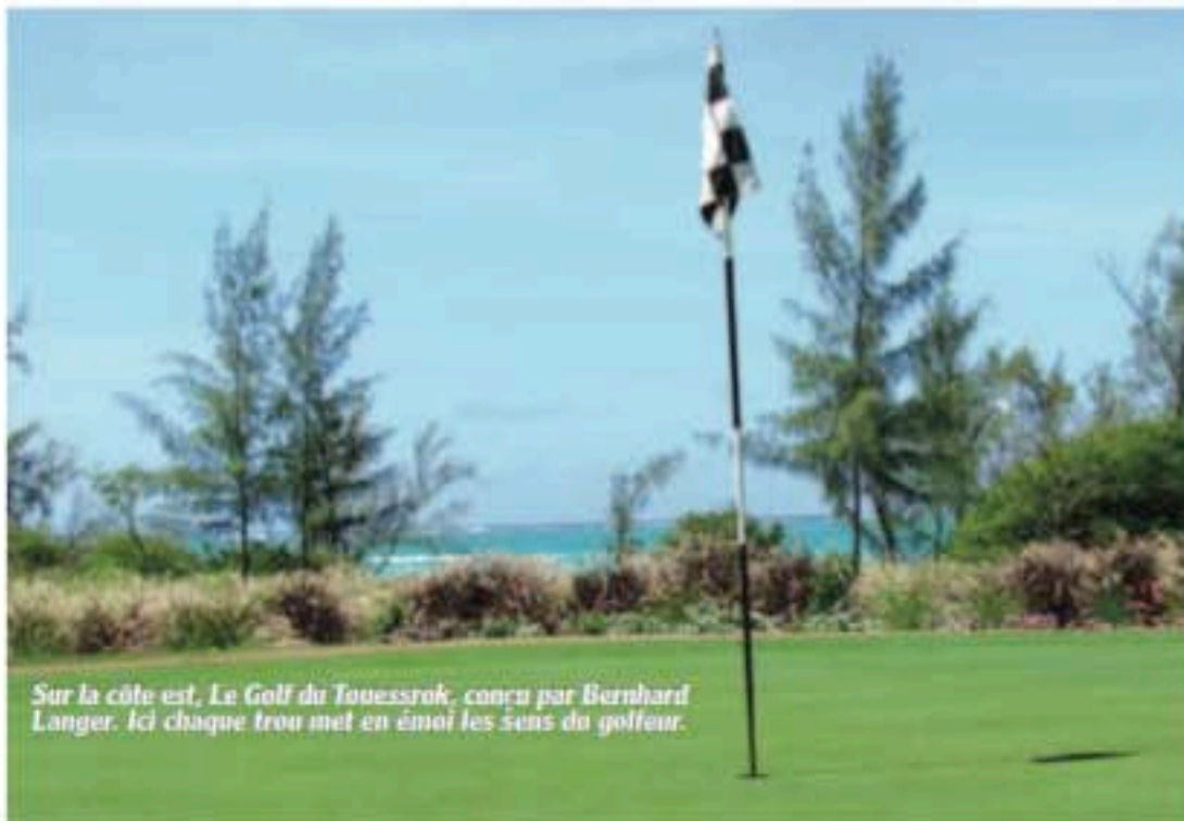
Sur la côte est, Le Golf du Touessrok, conçu par Bernhard Langer. Ici chaque trou met en émoi les sens du golfeur.

Ouvert en 2003, Bernhard Langer a conçu le Touessrok pour que chaque trou mette en émoi tous les sens du golfeur. De l'émoi, vous en aurez dans ce jardin botanique agrémenté de ses 9 lacs