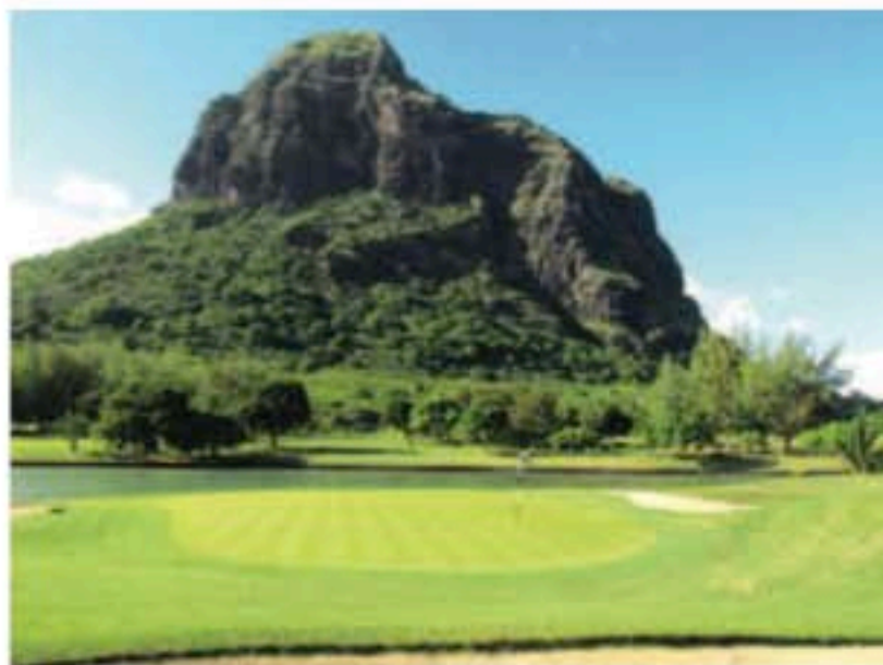
■ Le golf du Paradis : en toile de fond le Morne Brabant, patrimoine de l'Unesco