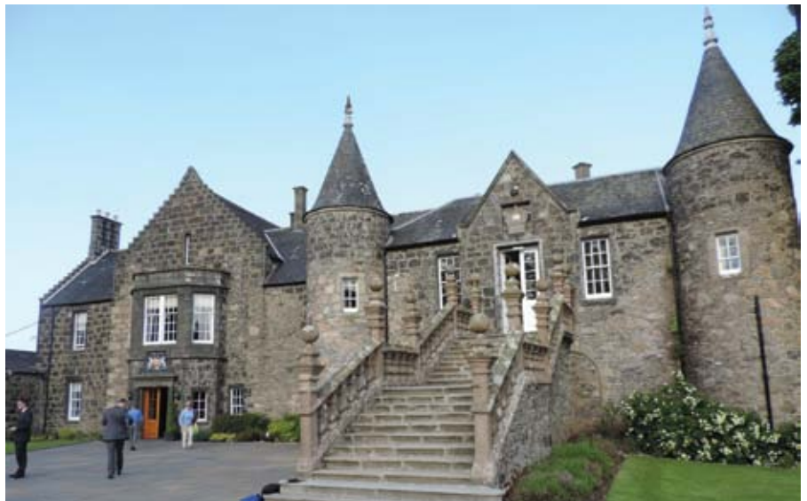
■ Le charmant manoir hôtel du Meldrum House Country Hotel & Golf Club permet de rayonner vers les links tout proches. Et le résident peut aussi arpenter le 18 trous de son coquet parcours.