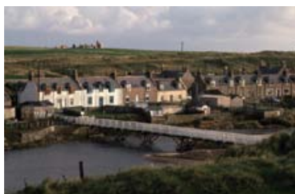
■ A Cruden Bay, au trou n°4 vue imprenable sur les cottages de pêcheurs de Port Errol. Au fond, l'envoûtant Slain Castle.