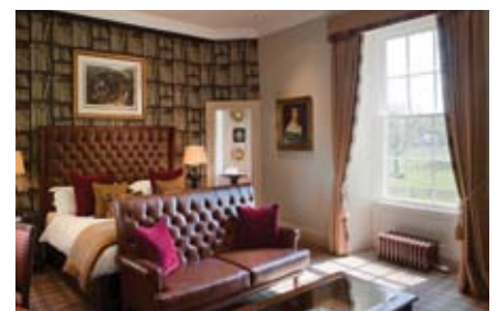
■ Décor très écossais et confort moderne pour les 28 chambres du manoir.