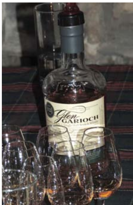
■ Le whisky, boisson nationale de l'Ecosse !