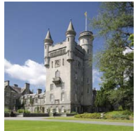
■ Le Château de Balmoral, résidence de la famille royale.