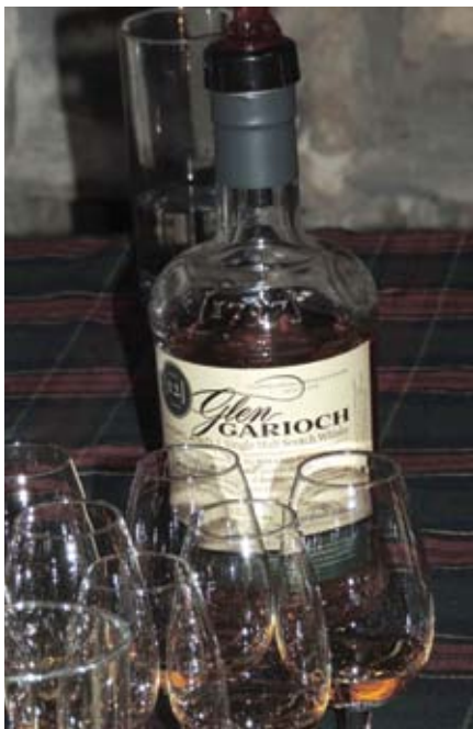
■ Le whisky, boisson nationale de l'Ecosse !